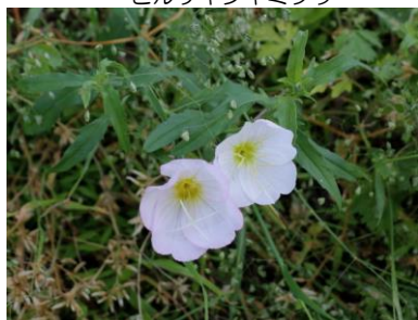
ヒルザキツクミソウ