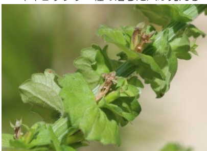
タチスズシロソウ その他重要種