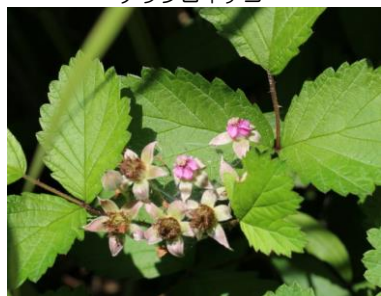
【そくら浜～北比良浜】 ナワシロイチゴ