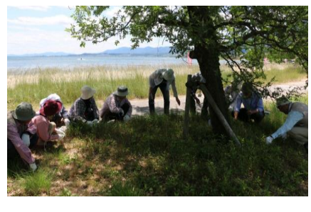
対岸を望む 沖島が見える