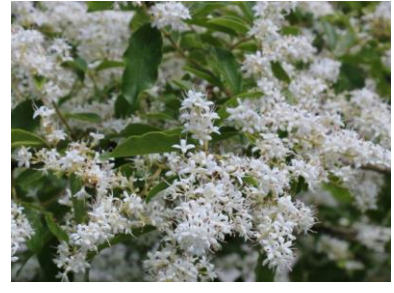
マキハブラシノキ