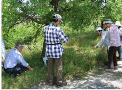
北比良浜のシンボルツリー アカメヤナギ