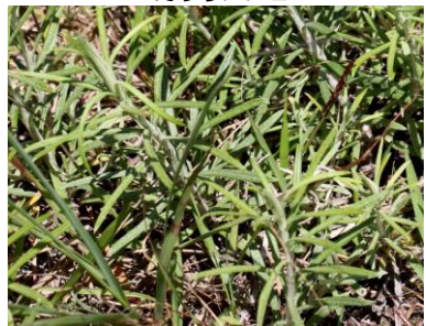
シナダレスズメガヤ