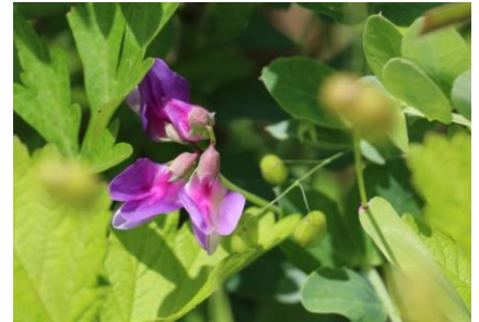
コモチマンネグサ