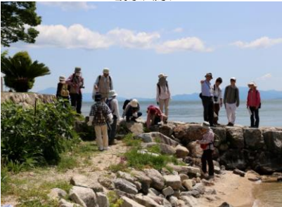
そぐら浜の「常夜灯」