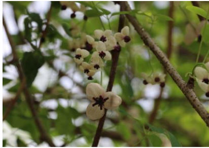
アケビの雌花と雄花