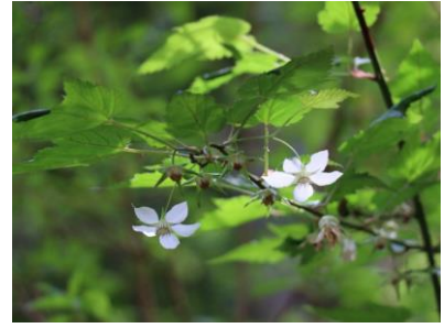
ナガバモミジイチゴ