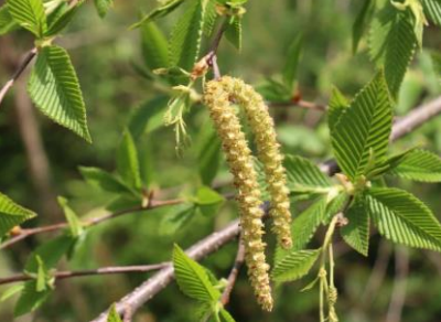
ヒメヤシャブシの雄花