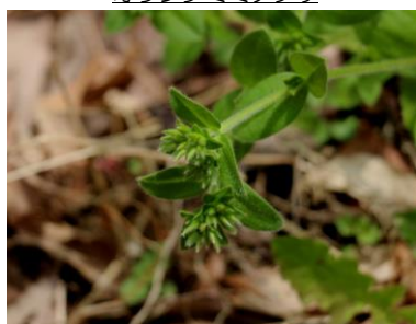
オランダミミナグサ