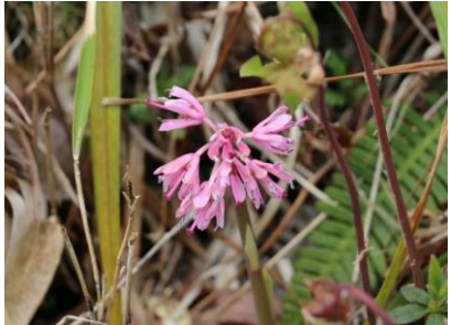
ショウジョウバカマ