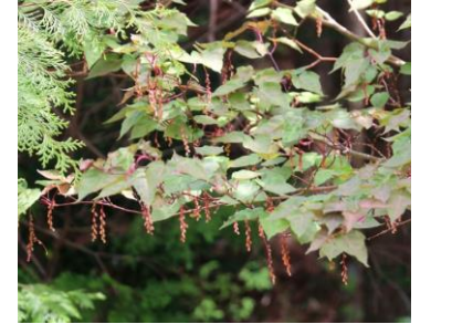
ウリカエデの雄花