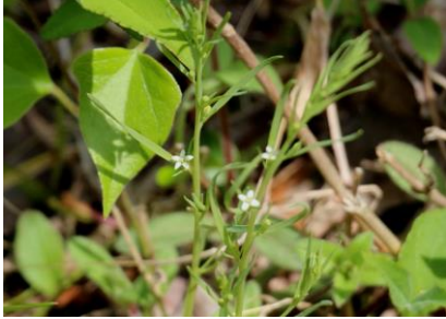
カナヒキソウ イネ科の植物に半寄生