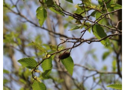
オオバヤシャブシの果実