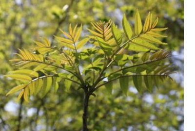
カラスザンショウの新芽