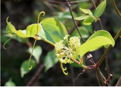
サルトリイバラの雄花