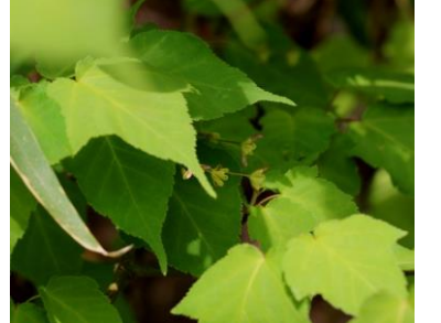
ウリカエデの雌花