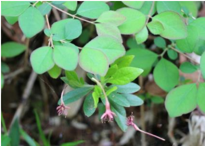
ヤマウグイスカグラ