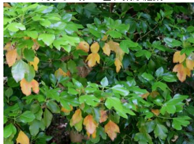
カクレミノ 古い葉が紅葉