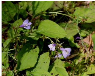
ムラサキサギゴケ