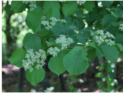
分枝する オオニワゼキショウ