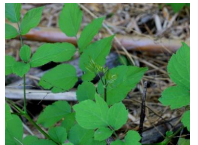
セイタカタンポポ