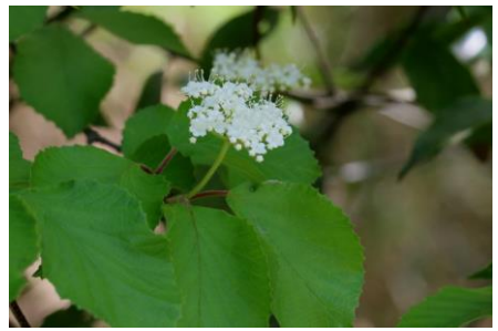
ガマズミ (植栽?) ガマズミ