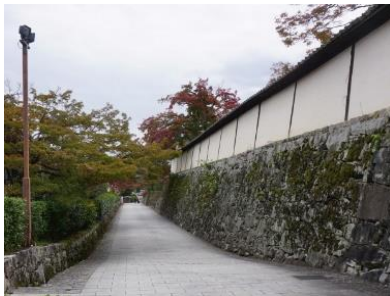
【山の辺の道 日吉大社東門～千体地蔵】