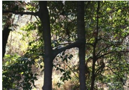
山の辺の道からの眺望 正面三上山