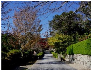
石垣に這う ツタの紅葉