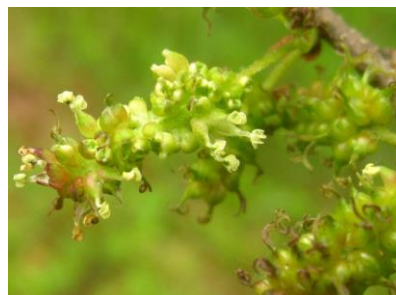
ヤマグワ 雌雄同株が珍しい