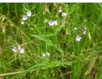
オオカワジシャ 外来種