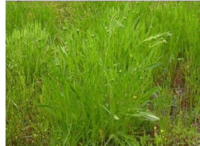
オオカワジシャ 外来種