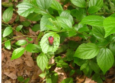
ヤマグワ 雌雄同株が珍しい