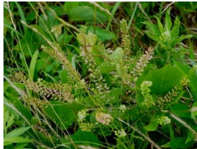
マメグンバイナスナ