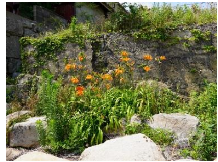
外来種 ワタゲツルハナグルマ