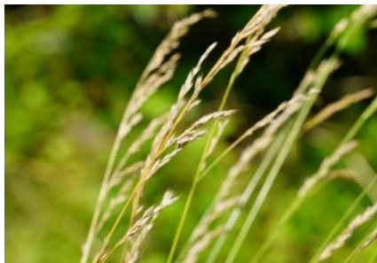
オオウシノケグサ