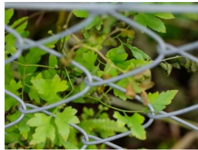
蔓性 カニコサ (シダ植物)