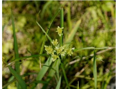
メリケンガヤツリ