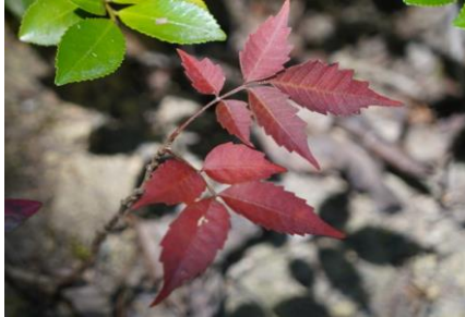
いち早い秋の便り ヤマハゼ