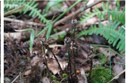
昨年の果実、ここには出ておらず