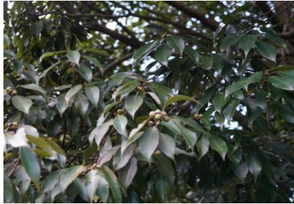
アラカシ 小さなどんぐりの顔