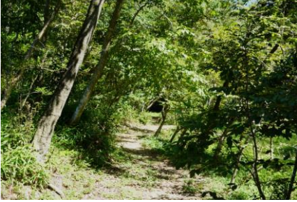
ため池へ続く観察路