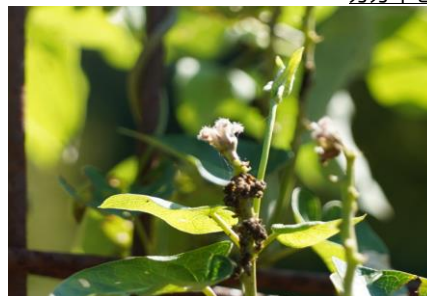
ツクシハギ 復活の優等生