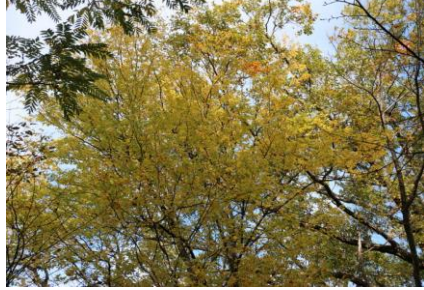
イヌザクラの黄葉