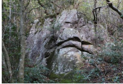
天児屋命 (あまのこやねのみこと)