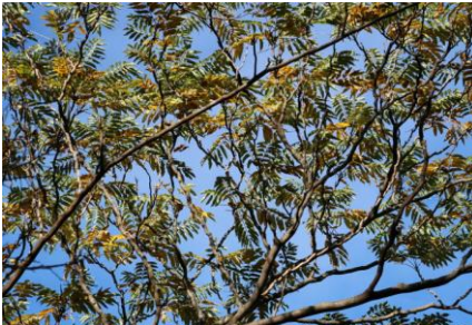
カラスガンショウ