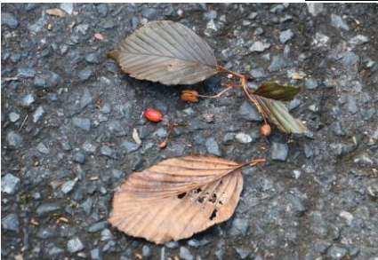
アズキナシの葉と果実