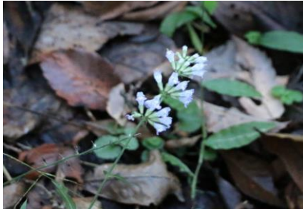
アキノタムラソウ