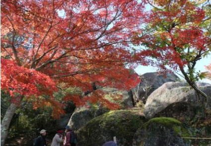
北向岩屋観音と紅葉