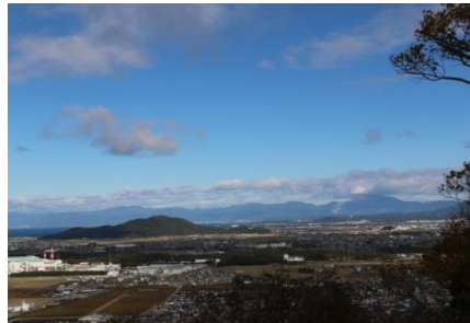
眺望 手前に荒神山 奥に伊吹山