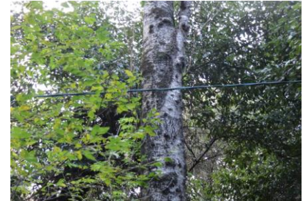
イヌザクラの木肌 (白っぽい)