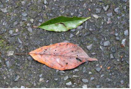
上 イヌザクラの葉 下 ヤマザクラの葉