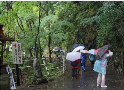
【天の岩戸神社】 神社参道に降り、元伊勢神宮鳥居前に戻る 天の岩戸神社入り口