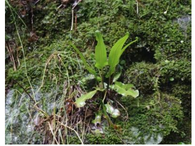
コタニワタリ 姫路では鉢植えて見た