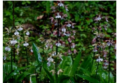
エビネ 境内に咲いていた