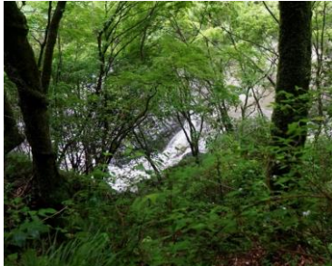
雨で増水した 宮川