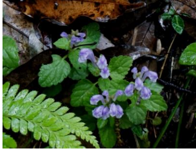
タツナミノウの仲間