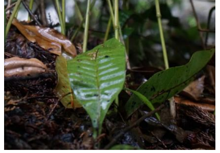
クリハラン 滋賀R「その他重要種」