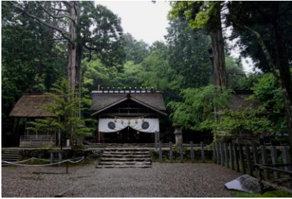
【元伊勢神宮内宮】 (皇大神宮) お祓い所