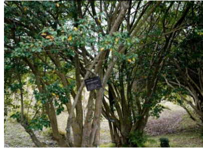
カラタネオガタマ