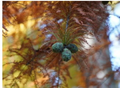
メタセコイアの果実