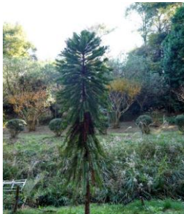
ウォレミパイン (ナンヨウスギ科)