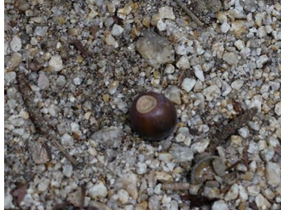
シリブカガシのドングリ