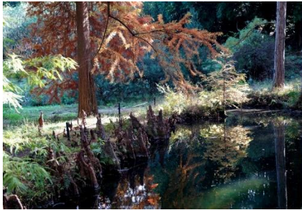
ラクウショウの呼吸根