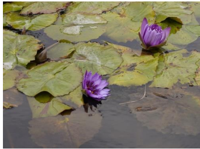
デレクター-G.T.ムーア (スイレン科)