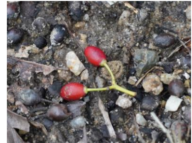
ナナミノキの果実