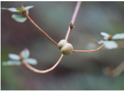
コバノミツバツツシに虫こぶ