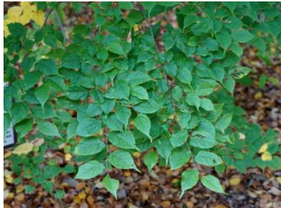
ハラノキ (葉が平ら)