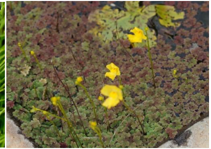
オオバナイトタヌキモ