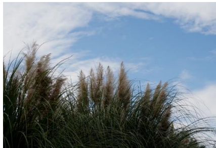
植物園管理棟前の シロガネヨシ