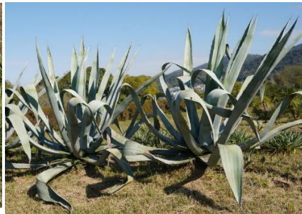
アオノリュウゼツラン