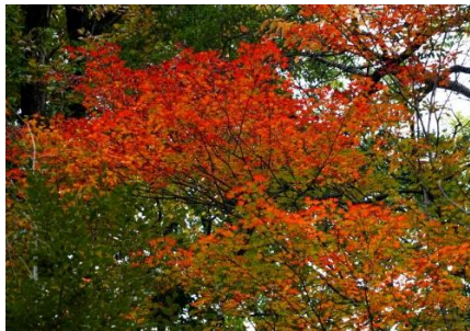
イロハモミジの紅葉