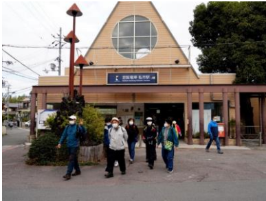
最寄り駅 京阪私市駅