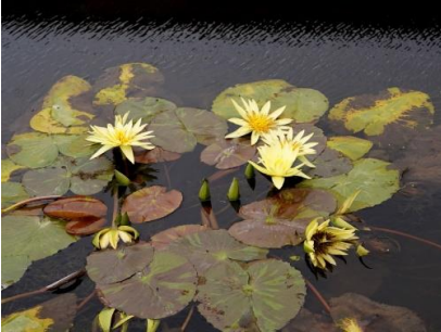
セントルイス・ゴールド (スイレン科)