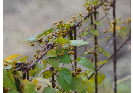
ヘクソカズラの果実