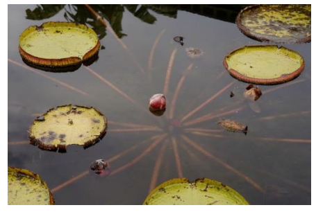
パラグアイオニバス