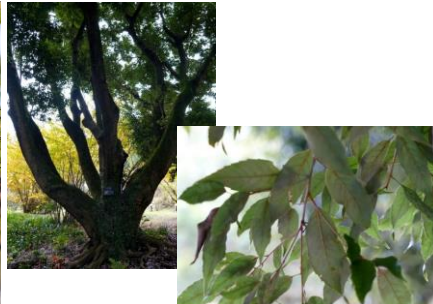
ウラジロガシ (葉裏が白っぽい)