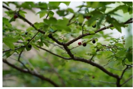
ミヤマウグイスカグラ