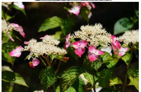
クレナイ 装飾花は白から真紅に