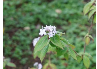
ミヤマヤエムラサキ