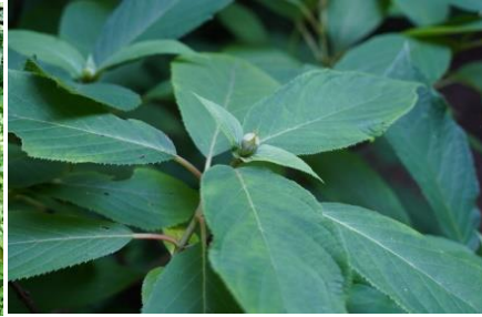
エゾアジサイ (手鞠系)