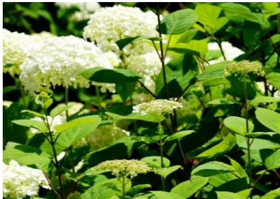
神戸私立森林植物園で育成された種