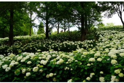
アナベルの先祖返り アメリカノリノキ