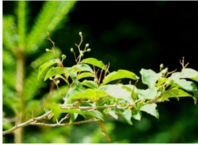
タンナサワフタギ