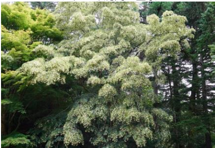
シナノキ満開 全景