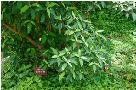
エゾアジサイ (佐渡の庄)

「あじさいの小路」～「アマベルの丘」～「メタセコイア並木」 西洋アジサイや育成された数々のアジサイが咲く アスペラ (ヒマラヤタマアジサイ) 常緑 タマアジサイ 遅咲き シノノメ (東雲) 星形・八重咲き