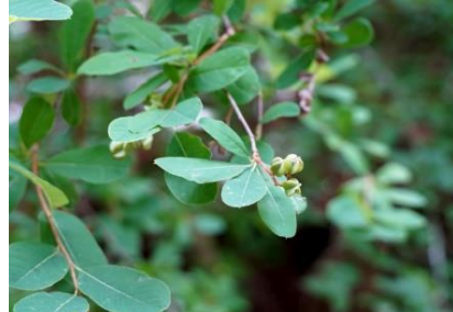
リュウキュウバイ