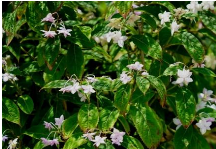
エゾアジサイ ヒメアジサイの原種