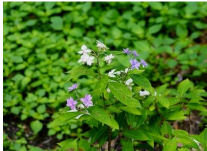
カラスヤマアジサイ