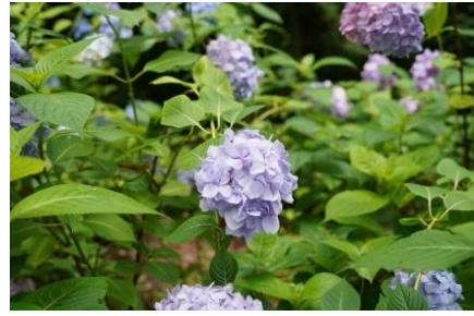
カシワバアジサイ (八重)