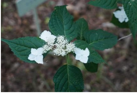
ベニガク 装飾花に鋸歯がある