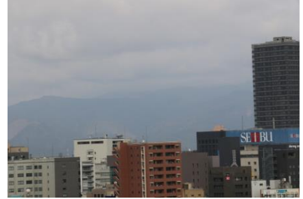
愛宕坂を登りきると「白山」が見える