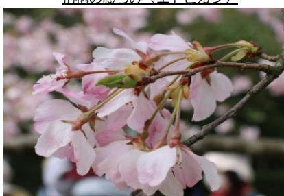
薄墨桜(サトザクラの園芸品種)