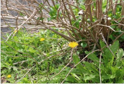
セイタカタンポポ