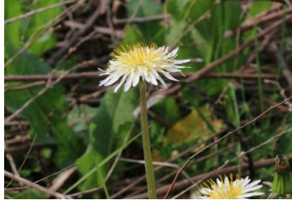
シロバナタンポポ