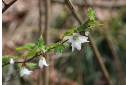
ナガバモミジイチゴ