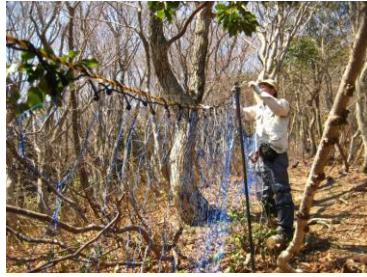
雪で落ちた保護ネット