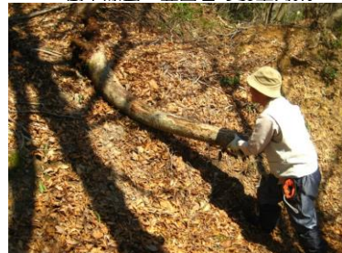
倒木除去 登山者の安全対策