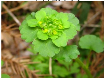
ヤマネコノメソウ