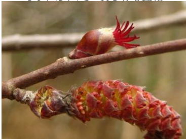
ツノハシバミ 真っ赤な雌花