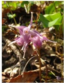
トキワイカリソウ