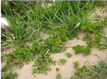
ハマナス・ハマニンニク・ハマヒルガオ