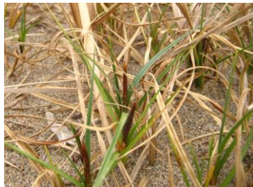
コウボウシバの蕾