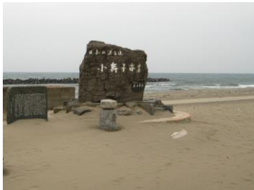
小舞子海岸 きれいな砂浜 「小舞子」