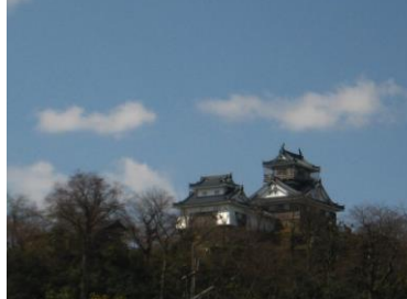
越前大野城 (天空の城)