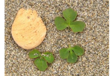
ハマニガナ 葉が三列