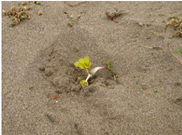
ハマボウフウ 根が食用