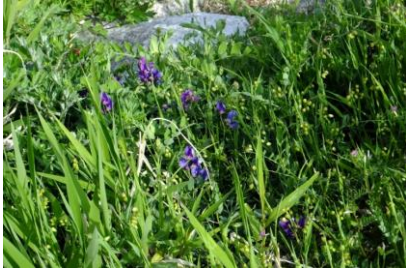
ハマエンドウ そぐら浜