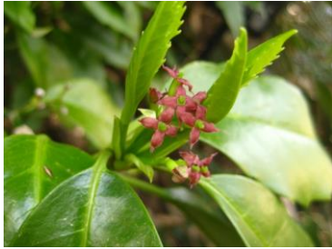
ヒメアオキの雌花