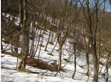
残雪 福井県との県境