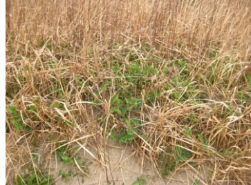
ハマエンドウ 滋賀県では希少種