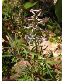
ミチノクエンゴサ