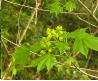
ウラゲエンコウカエデ