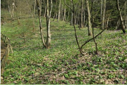
矢ばなの里 カタクリ カタクリの群生