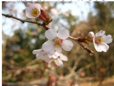
花が小さい キンキマメザクラ