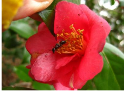
ユキバタツバキ 蟻が食事に