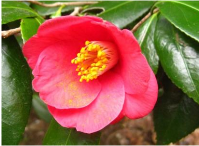
ユキバタツバキ 花粉を運ぶのは鳥