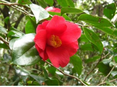
ユキバタツバキ 花粉を運ぶのは鳥