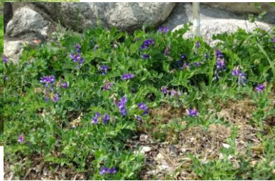
そぐら浜の ハマエンドウ