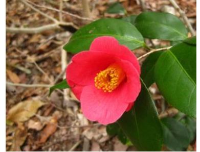
ユキバタツバキ 鳥を誘う蜜が