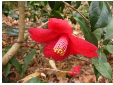
ユキバタツバキ 蟻が食事に