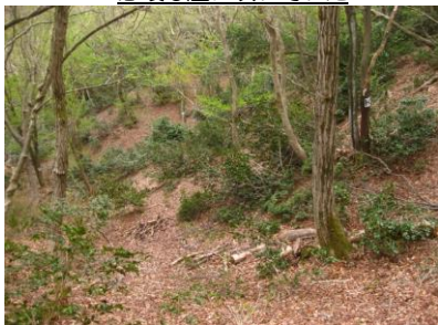
ユキバツバキ 桃色