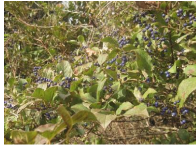
【余呉町中河内 焼き畑の実験栽培耕作跡地の植生調査】 タンナサワフタギ