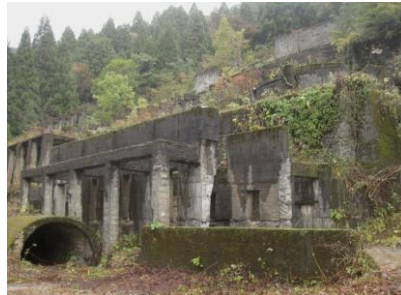
選鉱工場跡 冬雪深い地の美味しい山菜4品 ミヨウガ