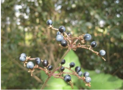
【草津市 印岐志呂神社の植生調査】 ヤブミョウガの果実