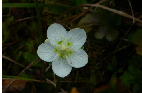
ムラサキセンブリ