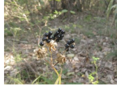
【東近江市 河畔林】 ヒオウギズイセンの果実 「ぬぼたま」