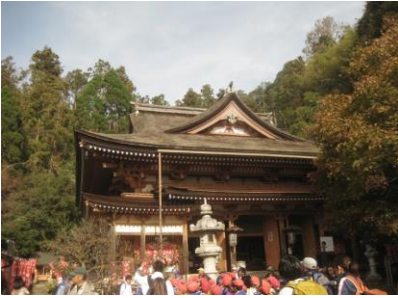
【竹生島 タブノキの再生事業】 竹生島 大勢の子供達と