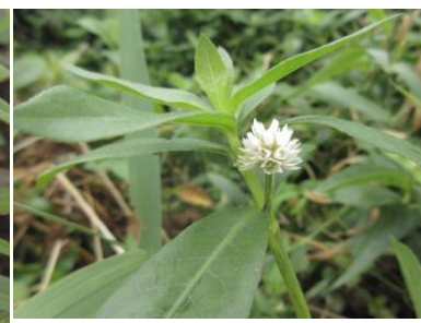
ナガエツルノゲイトウ