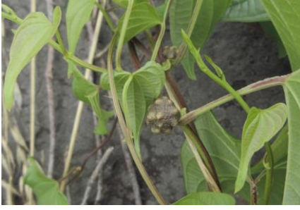
ニガガシウのむかご