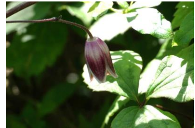
白花ベニドウダン