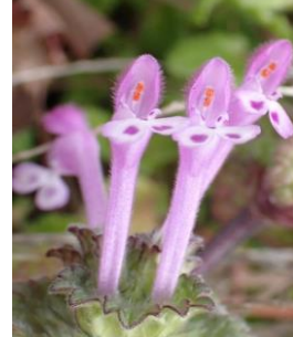
仏様の台座型に整然と並ぶ