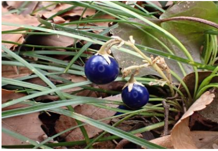
ナガバジャノヒゲ