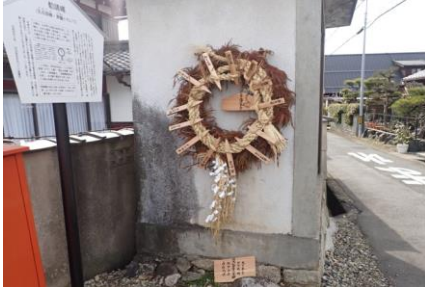
勸請縄 集落への邪悪なものの侵入を防ぐ願い