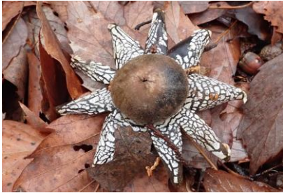
ツチグリ 真冬に思わぬキノコ