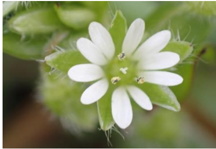
ハコベ たぶんミドリハコベと思われる