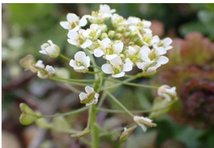
ナズナ 早くから咲いていたようです