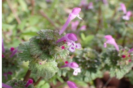
ホトケノザ 畑をピンク色に染める