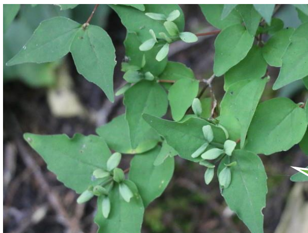
コツクバネウツギ