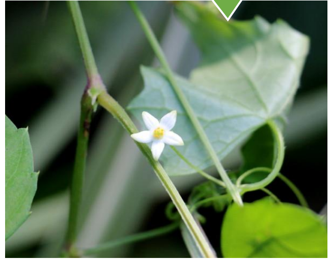
スズメウリの雄花