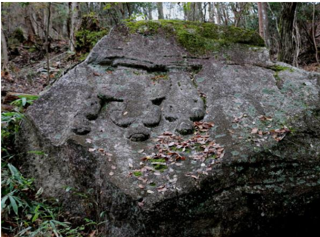
逆さ観音（工事中に落ちて）