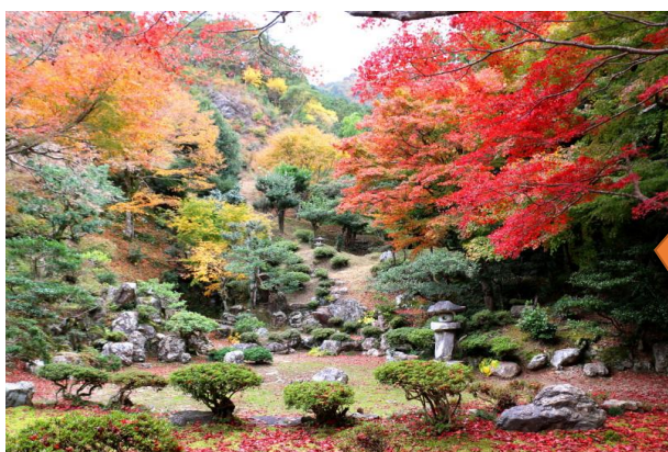
徳源院 回遊式庭園 県指定の 名勝