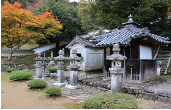
京極家歴代の墓所 国指定の史跡