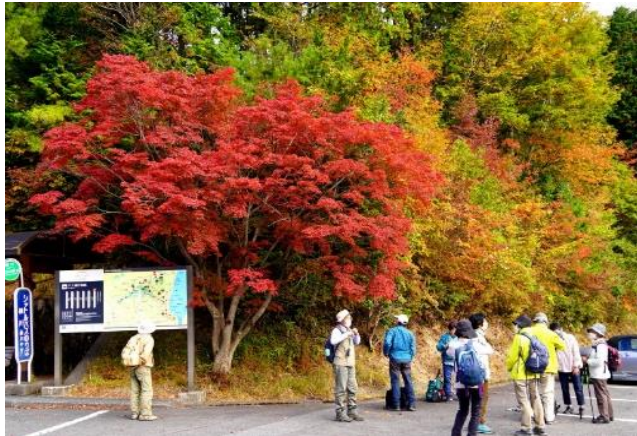
まだ紅葉には早いと思っていたが

堅田・雄琴駅からバスで集合場所「比叡山横川」に到着 観察会の詳細は、鋭意作成中です。