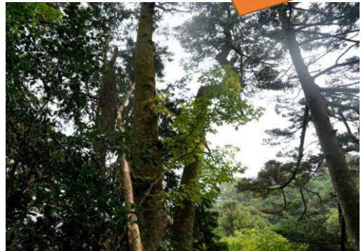
山頂付近の林は立派な「モミ林」