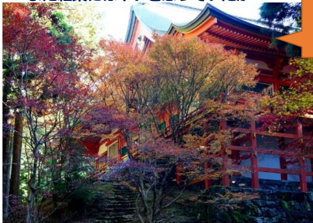
横川中堂をバックに オオモミジの紅葉